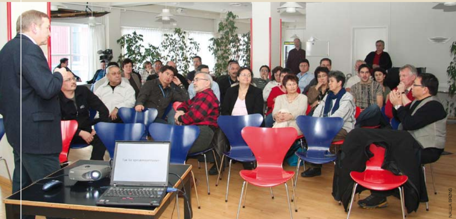
Inatsisartunut ilaasortat Royal Arctic Linemut pulaarnerat Medlemmerne af Landstinget under besøget i Royal Arctic Line

Jens Andersenip ilaatigut makku sammivai: Suliassat aamma akuersissut, nassiussat qanoq ineriartornerat, natsinni umiarsualiviit ineriartornerat, Danmarkimi qitiusumik umiarsualiveqarfik, Canadamut assartuineq, ilinniar-titaaneq naleqartitavut isummertarnerillu, kiisalu suliffeqarfiup iliuuseriniagai suliariumasaalu. ■